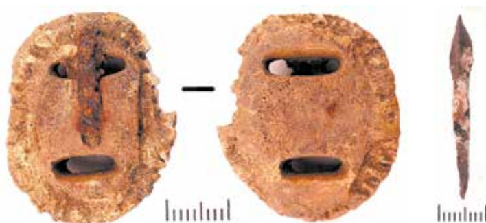
Рисунок 6. Могильник Кансар. Курган 25. Предметный комплекс: 1,2,4 – изделия из железа; 3 – наконечник стрелы; 5 – подпружная пружка.