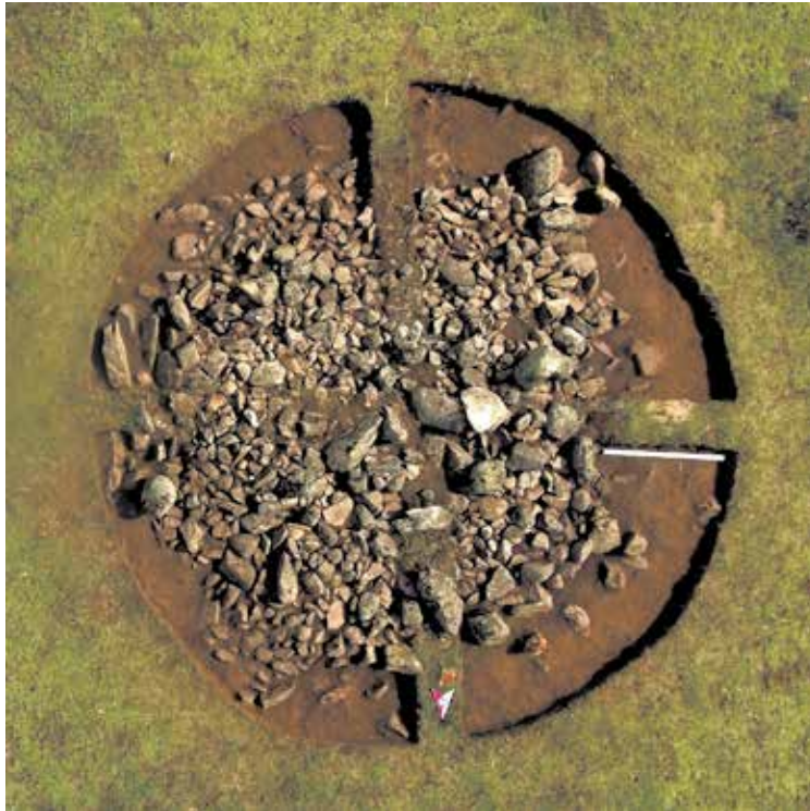
Рисунок 1. Могильник Кансар. Курган 22. Вид после зачистки насыпи

Курган 22. Исследованный курган расположен в ЮВ части могильника. До начала раскопок курган был интенсивно задернован. Насыпь кургана сложена из камня, в разрезе уплощенной, в плане неправильной подчетыреугольных очертаний (рис. 1). Размеры кургана по линии: СЮ – 6,2 м, ВЗ – 6 м.