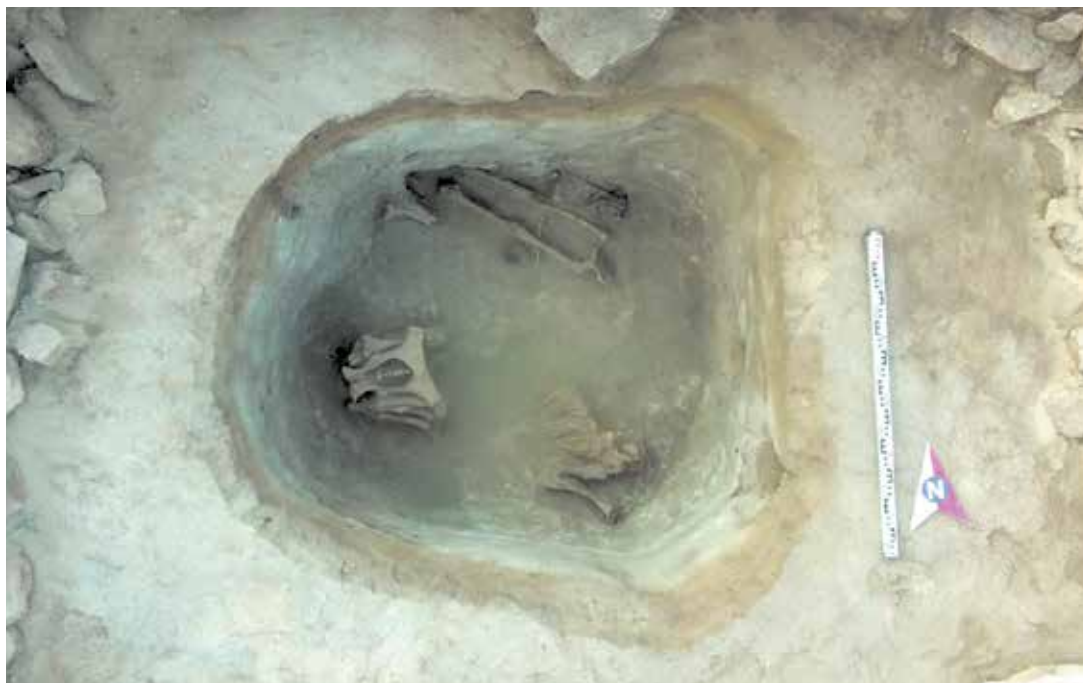
Рисунок 8. Могильник Кансар. Курган 14. Могильная яма

Вдоль южной стенки обнаружен неполный костяк коня, ноги были поджаты под себя, отсутствовал череп животного. Судя по расположению нетронутых останков погребенного человека и коня, они оба головой были ориентированы на восток. Других предметов сопроводительного инвентаря и деталей погребальной обрядности не выявлено.