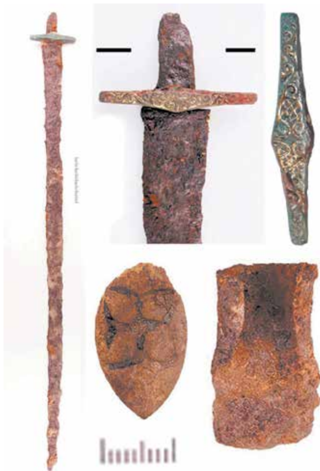
Рисунок 3. Могильник Кансар. Курган 22. Предметный комплекс: 1 – сабля; 2 – топор-тесло; 3 – изделие из бронзы; 4 – костяная подделка с изображением четырехлистника; 5 – фрагмент удила; 6- перекрестье сабли

отсутствовали кости верхнего отдела начиная от тазовых костей (рис.5). Судя по нетронутым костям, умерший был уложен на спину, головой был ориентирован на восток. Вдоль северной стенки обнаружен костяк лошади, круп завален на левый бок, ноги согнуты, голова ориентирована в противоположную умершему человеку направлению т.е. на запад. Захоронения человека и животного по центру разделяла каменная перегородка из крупных камней. В заполнении могильной ямы найдены железный стержень со шляпкой длиной 5 см, шпенец – 7 мм, фрагмент железной подделки с прорезью в верхней части, железная пряжка, роговая подпружная пряжка округлой формы с железным язычком (рис.6). Других предметов сопроводительного инвентаря не обнаружено.