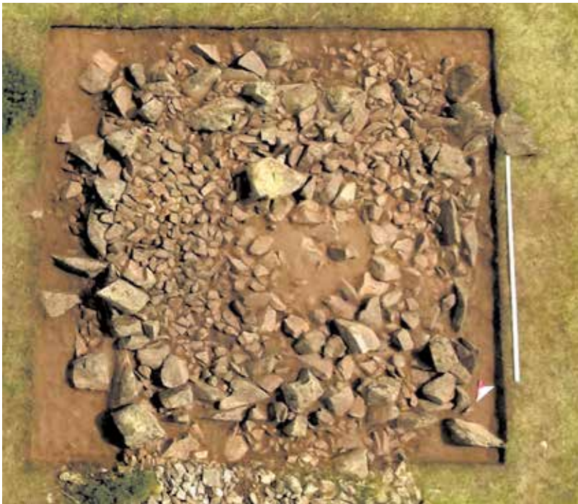
Рисунок 7. Могильник Кансар. Курган 14. Вид после зачистки насыпи

Курган 14. Расположен севернее в 10 м от кургана №22. Насыпь кургана сложена из камня, в разрезе уплощенной, в плане неправильной четырехугольной формы (рис.7). Размеры кургана по линии: СЮ – 7 м, ВЗ – 6, 1 м. По периферии кургана виднелась каменная ограда четырехугольной формы, составленная из крупных каменных плит, поставленных на ребро. Диаметр каменной ограды – 6 м. Разбор каменной насыпи до уровня древней поверхности показал наличие в центре наземного сооружения надмогильной выкладки. Под выкладкой оказалась могильная яма подквадратной формы с закругленными краями. Параметры ямы: глубина – 1, 2 м, длина – 2,2 м, ширина – 1,8 м. В заполнении ямы на разных уровнях обнаружены бронзовая пряжка с подвижным язычком и бляшка поясного набора, роговая подпружная пряжка (рис. 9). На дне ямы, обнаружен неполный костяк человека, отсутствовали кости, начиная от тазовых костей. Рядом с левой ногой, на уровне коленного сустава обнаружена костяная поделка стержневидной формы с обработанными концами, а также невысокий сосуд грубой отделки темного цвета с округлым дном (рис.8). На уровне ступни левой ноги обнаружена хвостовая часть МРС. Рядом с правой ногой выявлен берестяной колчан с разнотипными железными наконечниками стрел (рис. 9).