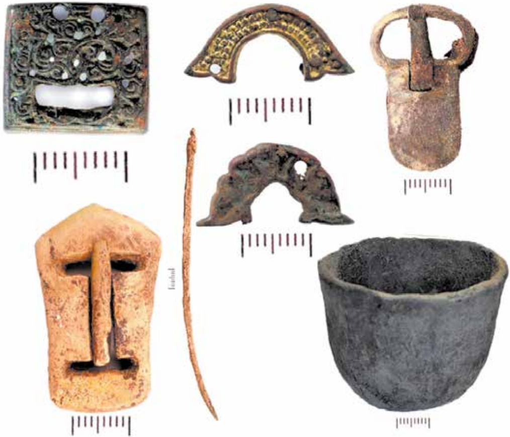
Рисунок 9. Могильник Кансар. Курган 14. Предметный комплекс: 1 – бронзовая пряжка; 2 – керамика; 3 – бляшка; 4 – изделие из кости

Сопроводительный инвентарь погребений состоит из предметов вооружения (сабля, топор-тесло, железные наконечники стрел), конского снаряжения (роговые пряжки, фрагменты удила) и предметов, относящихся непосредственно к человеку (пряжки пояса, бляшки). Все это позволяет определить культурно-хронологическую принадлежность изученных памятников. Структура надмогильных и внутримогильных сооружений, сопребение лошадей во всех трех курганах, а также положение и ориентация погребенных соответствует культуре древних тюрков. В предстоящем году планируется продолжение научно-исследовательских работ на могильнике Кансар, с целью уточнения социокультурных процессов, происходивших на территории Казахского Алтая в древнетюркскую эпоху.