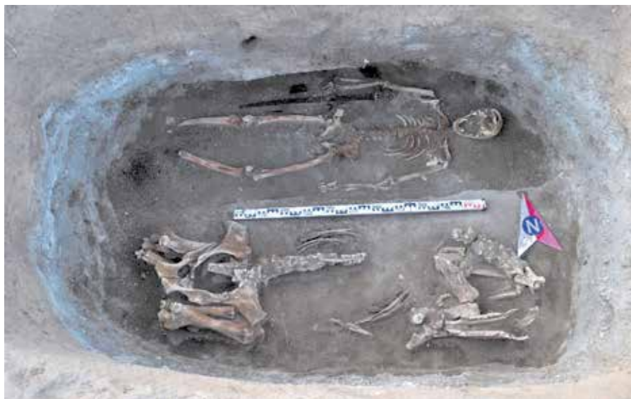
Рисунок 2. Могильник Кансар. Курган 22. Могильная яма

Рядом с костяком умершего обнаружен набор вооружения легковооружённого всадника: разнотипные железные наконечники стрел, железный топор-тесло и сабля. Последний обнаружен с правого бока умершего. Однолезвийная сабля имеет плавно изогнутый железный клинок и рукоять. Гарда с оригинальным навершием выполнена из бронзы. Топор-тесло с широким лезвием и несомкнутой втулкой, последняя немного шире. Также, в районе правого плеча найден элемент верхней одежды в виде бронзовой проволоки с четырьмя выступами. В том же районе обнаружена костяная поделка подовальной формы с заостренным нижним концом. На поверхности изделия имеется изображение четырехлистника (рис. 3). Других предметов сопроводительного инвентаря не обнаружено.